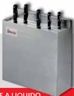
STERILIZZATORE A LIQUIDO